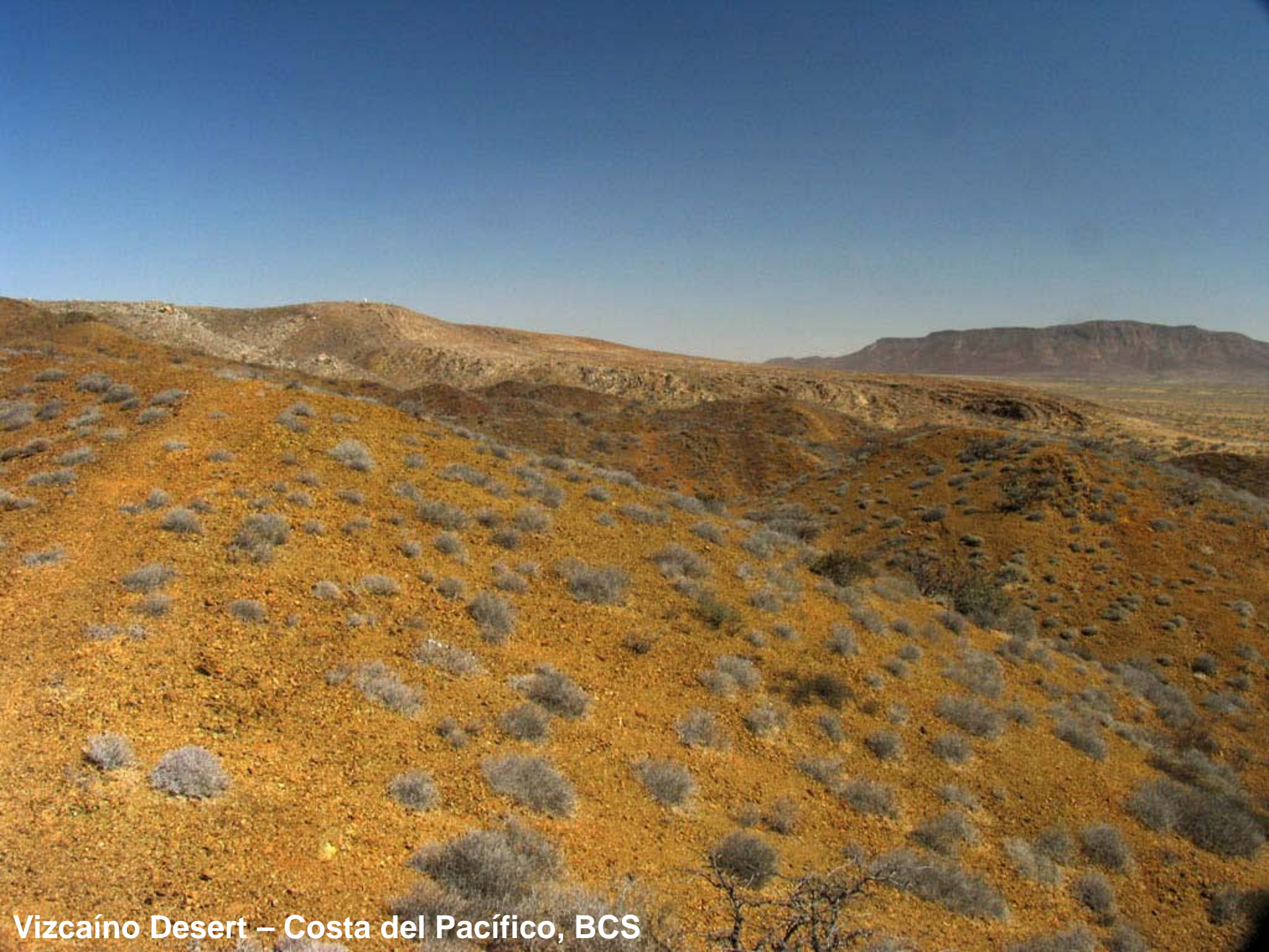
Vizcaíno Desert – Costa del Pacífico, BCS