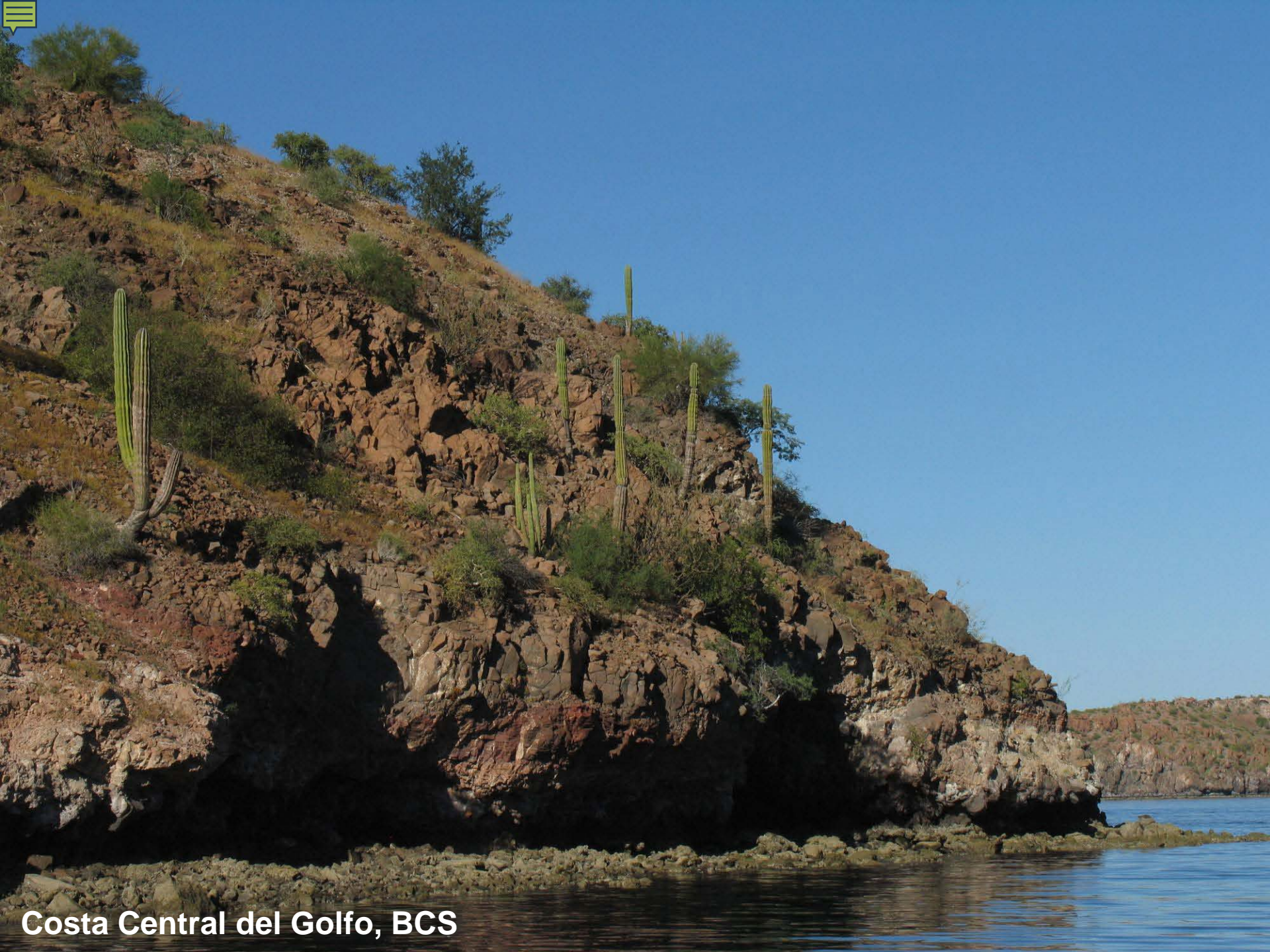
Costa Central del Golfo, BCS