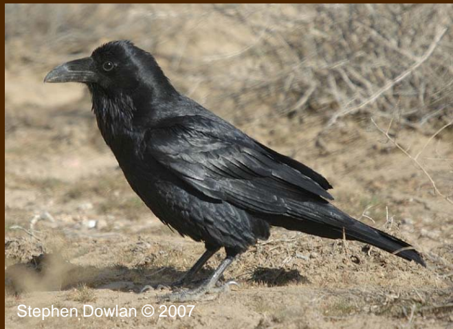
Stephen Dowlan © 2007