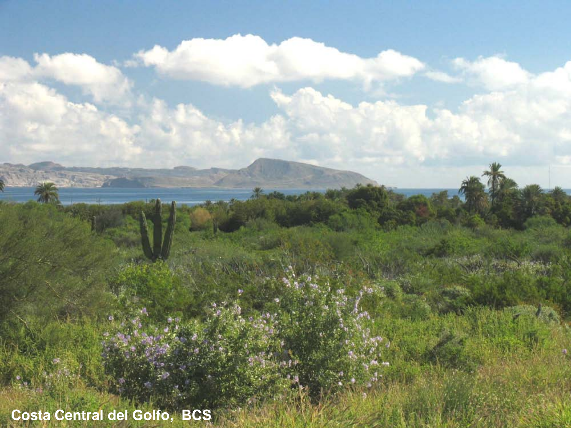
Costa Central del Golfo, BCS