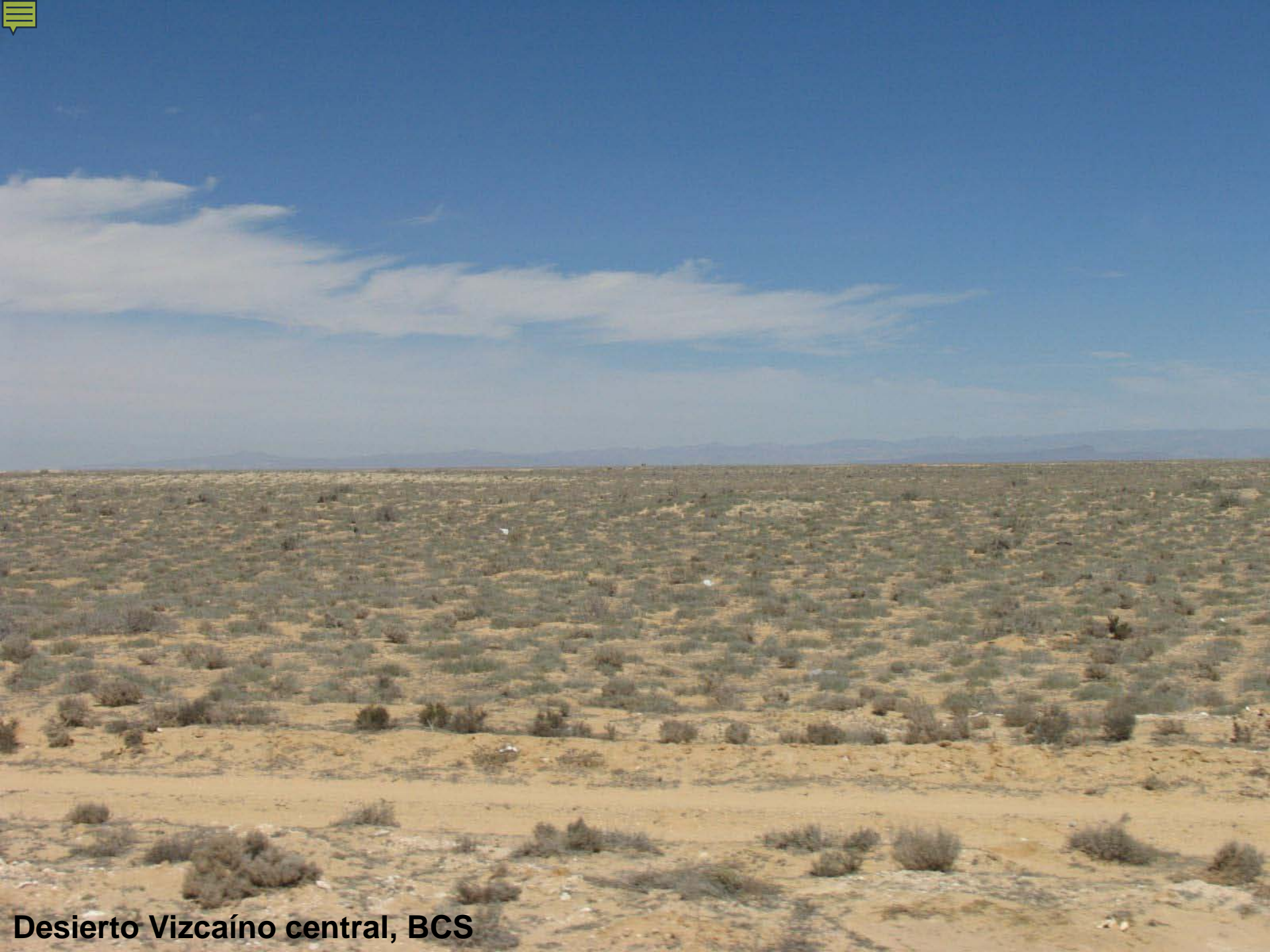
Desierto Vizcaíno central, BCS