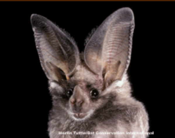
Mexican Tuttle Bat Conservation International